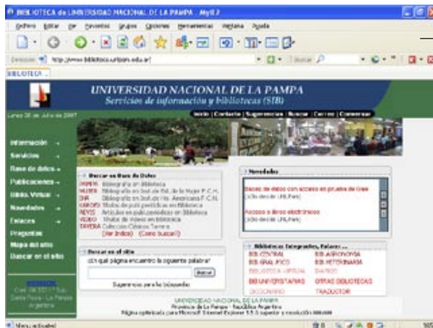
Portal de la página web de la biblioteca central de la UNLPam.

A raíz de la inclusión de las revistas Circe de Clásicos y Modernos , Anclajes , La Aljaba y Quinto Sol de la facultad de Ciencias Humanas en el Núcleo Básico de Revistas Científicas y Tecnológicas Argentinas, el personal del área de Tecnologías de la Información de Biblioteca Central de la UNLPam asistió a una capacitación específica para la incorporación de dichas publicaciones al sitio SciELO (Biblioteca Científica Electrónica en línea, por sus siglas en inglés).