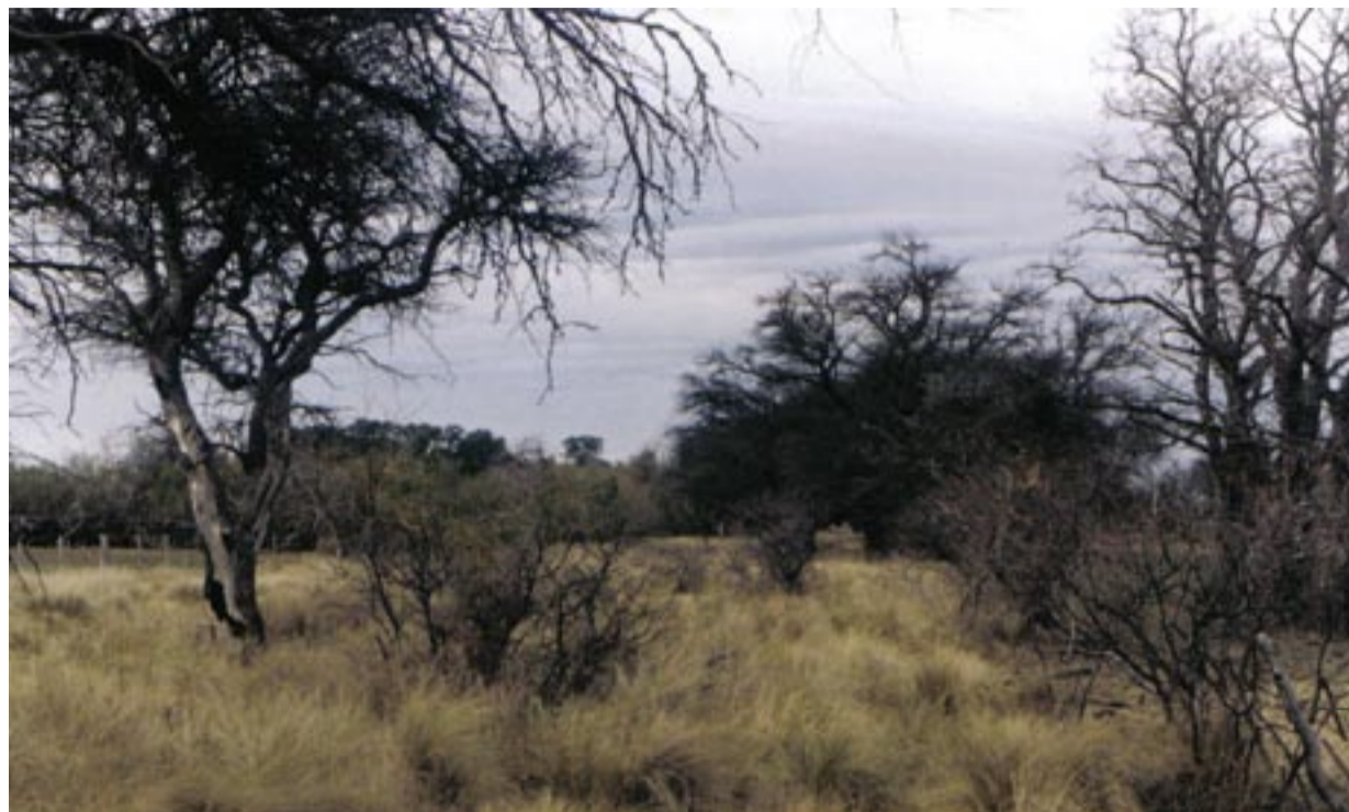
Vista típica de un bosque de caldén.

Tratar el tema de “uso de la tierra y su relación con la diversidad biológica”, es de por sí complejo y admite variados enfoques, desde lo histórico, lo político, lo económico y lo social y, por supuesto, lo estrictamente biológico, aunque ninguno de ellos es independiente de los otros.